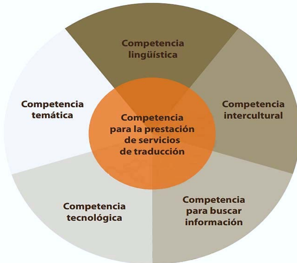
Figura 2. Descripción de la competencia de traducción según el modelo EMT (Olalla, 2017, p.159).

Nótese la coincidencia entre ambos modelos (independientemente del empleo de una terminología diferente), así como la estrecha conexión e interdependencia entre las subcompetencias y el carácter de resultado de uno y otro modelo.